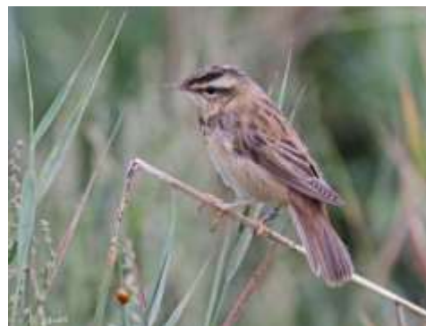
Phragmite des joncs