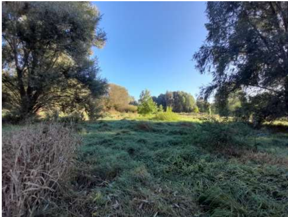
Forêt galerie de Saules blancs